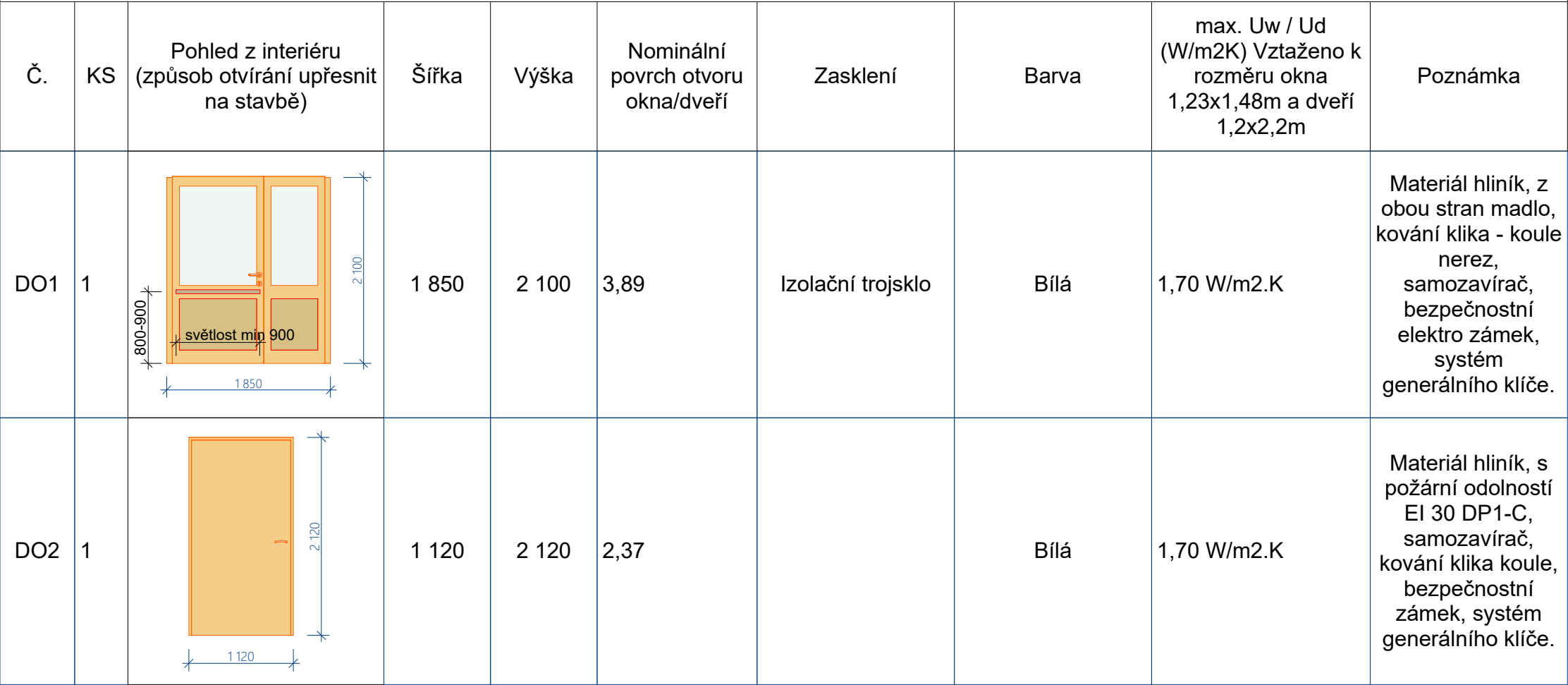
Tab1- Tabulka vnějších výplní otvorů (materiál plast, kromě DO1 a DO2, rozměry upřesnit na stavbě)